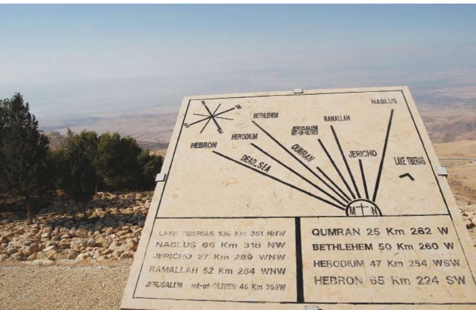
Desde este mirador, en el Monte Nebo, se aprecia la Tierra Prometida que vio Moisés al llegar.