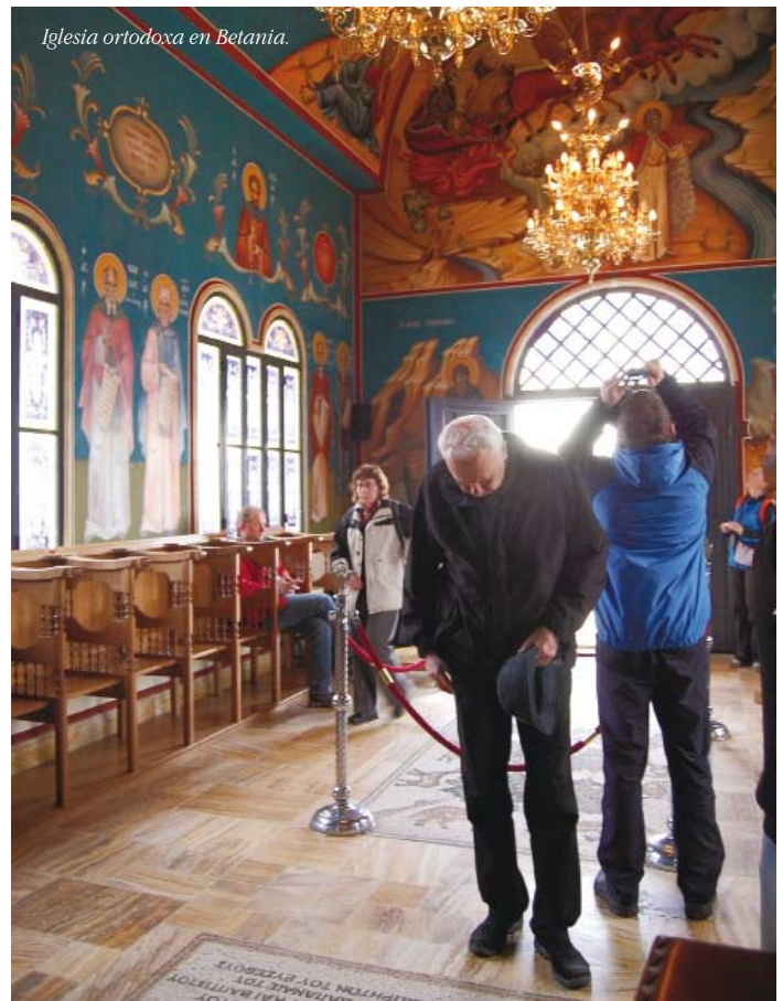
Iglesia ortodoxa en Betania.