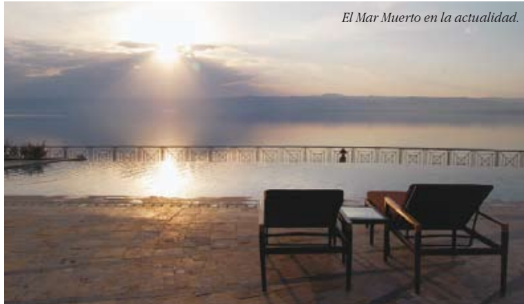
El Mar Muerto en la actualidad.

H oy permanece, como curioso testigo de la historia bíblica del Mar Muerto, una roca con forma de mujer que, según los locales, es la estatua de la esposa de Lot, quien se habría convertido en sal al voltear la cabeza para ver como la ciudad se destruía.