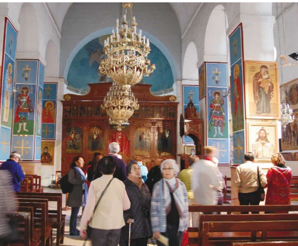
En la iglesia de San Jorge se encuentra el mapa, hecho de mosaicos, de la Tierra Prometida.

Según la representación que se hace del mar en el mosaico de la iglesia de San Jorge, en Madaba, en la antigüedad el Mar Muerto era más grande que su tamaño actual, que alcanza los 625 km 2 y ha bajado un metro cada año en los últimos 25 años. Parte del descenso se debe a la explotación que han hecho de éste las industrias cosméticas, debido a las propiedades de su barro y aguas. Para "salvar de la muerte" al Mar Muerto, se ha ideado un plan para bombear agua desde el Mar Rojo; pero claro, esto involucra el acuerdo con las otras naciones cuyas costas bordea.