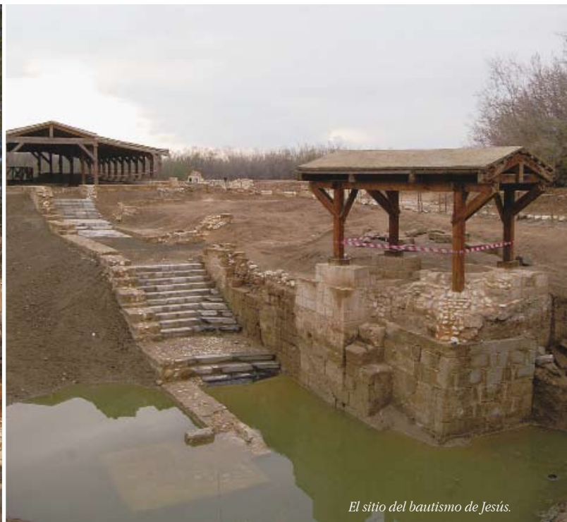
El sitio del bautismo de Jesús.